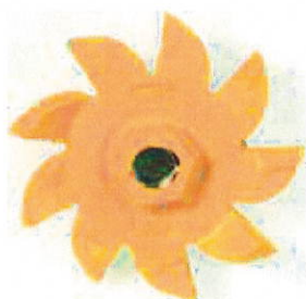
Fresa Euro 25